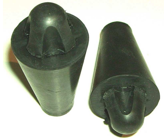
Puffer für Audi 100/Coupé ab Bj. 9.73 Zur Zeit ausverkauft!

Wenn die Motorhaube klappert, vibriert oder sich nicht mehr ohne Helfer öffnen lässt, wird es Zeit für neue Motorhaubenpuffer, denn dadurch bekommt die Haube wieder den nötigen Druck, um sich aus den geöffneten Schlössern zu entriegeln. Diese Motorhaubenpuffer sind bei fast jedem Fahrzeug deformiert, bzw. platt gedrückt.